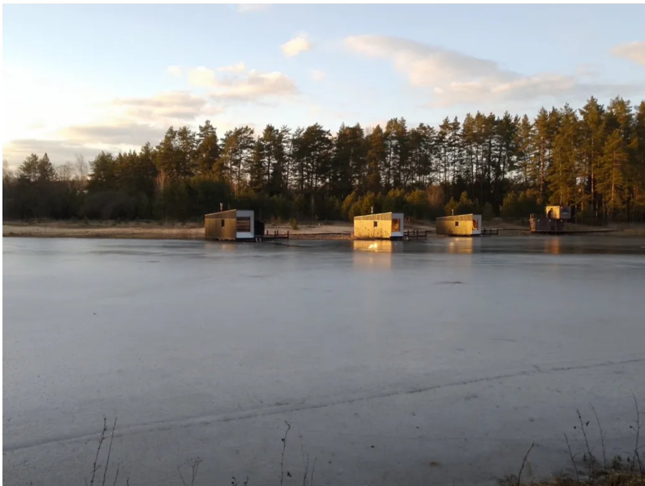
На выходе с маршрута база отдыха Город Солнца

По пути можно зайти на загородным комплекс отдыха Город Солнца который располагается у западных границ заказника Подсады. Там при необходимости можно снять домик и остаться на ночевку.