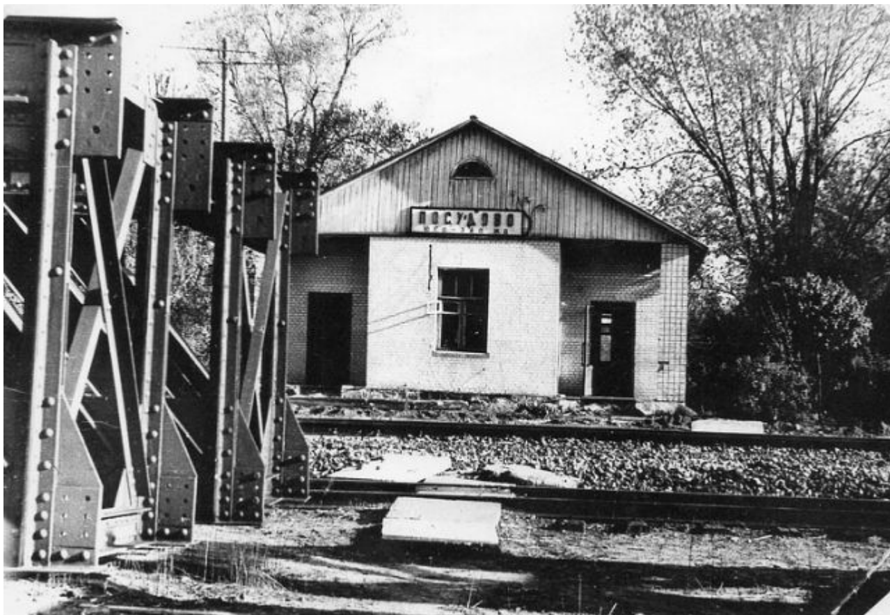
Жд станция Посудово в 1990-е

Названный также в честь соседствующей деревни Посудово. Станция примечательна наличием по соседству остатков двух тепловозов неподалеку от рельс. Отдельный репортаж посвящен этим заброшенным поездам тут же на нашем сайте ВТЛ.