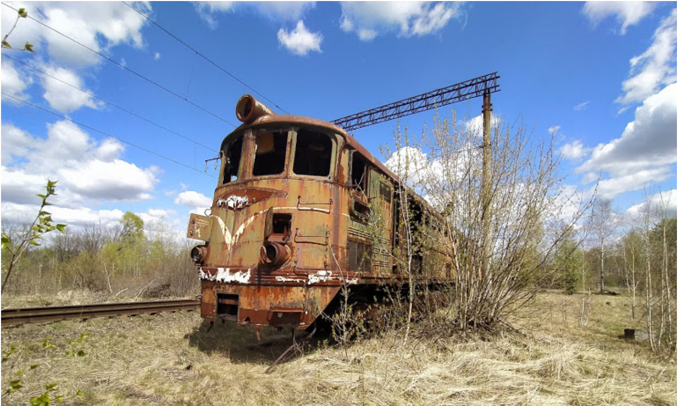
Локомотивы вблизи станции Посудово в Беларуси.