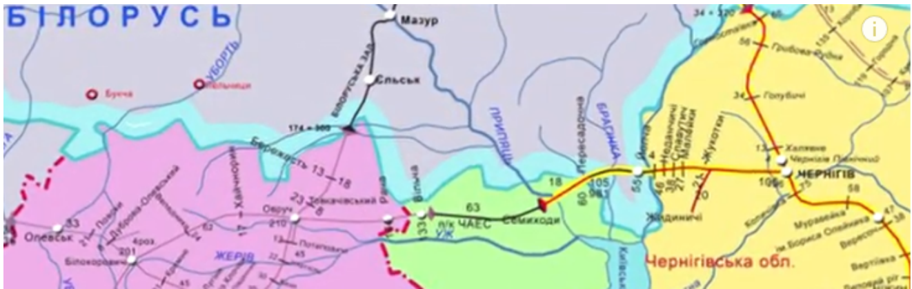
Карта ЖД Чернигов Семиходы (Янов)

Строилась данная жд ветка в тяжелых условиях. Раньше эти полесские земли были трудно доступны из-за суровых неприступных природных ландшафтов. Сплошные болота и реки жили по своим правилам до вмешательства человека.