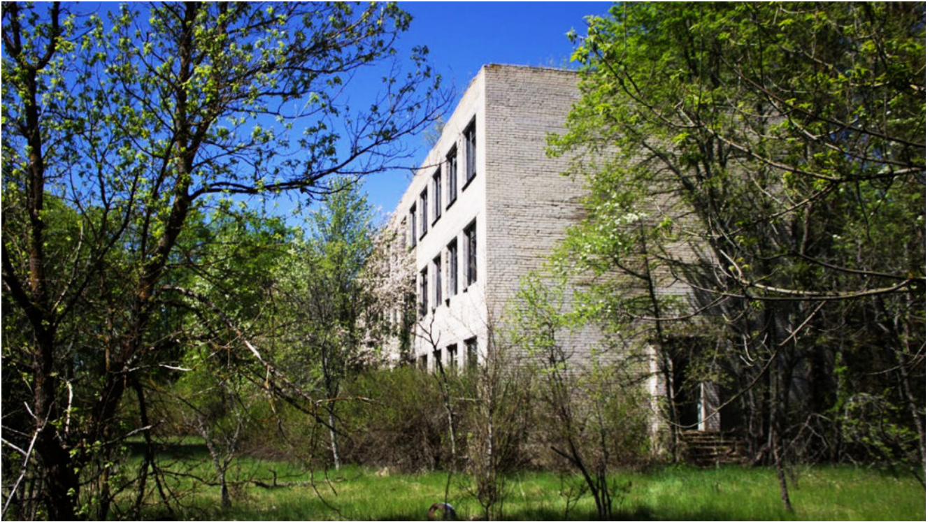
Трехэтажная школа в Дёрновичах. Внутри школы мало, что сохранилось до наших дней. Некоторые артефакты все таки выжили.