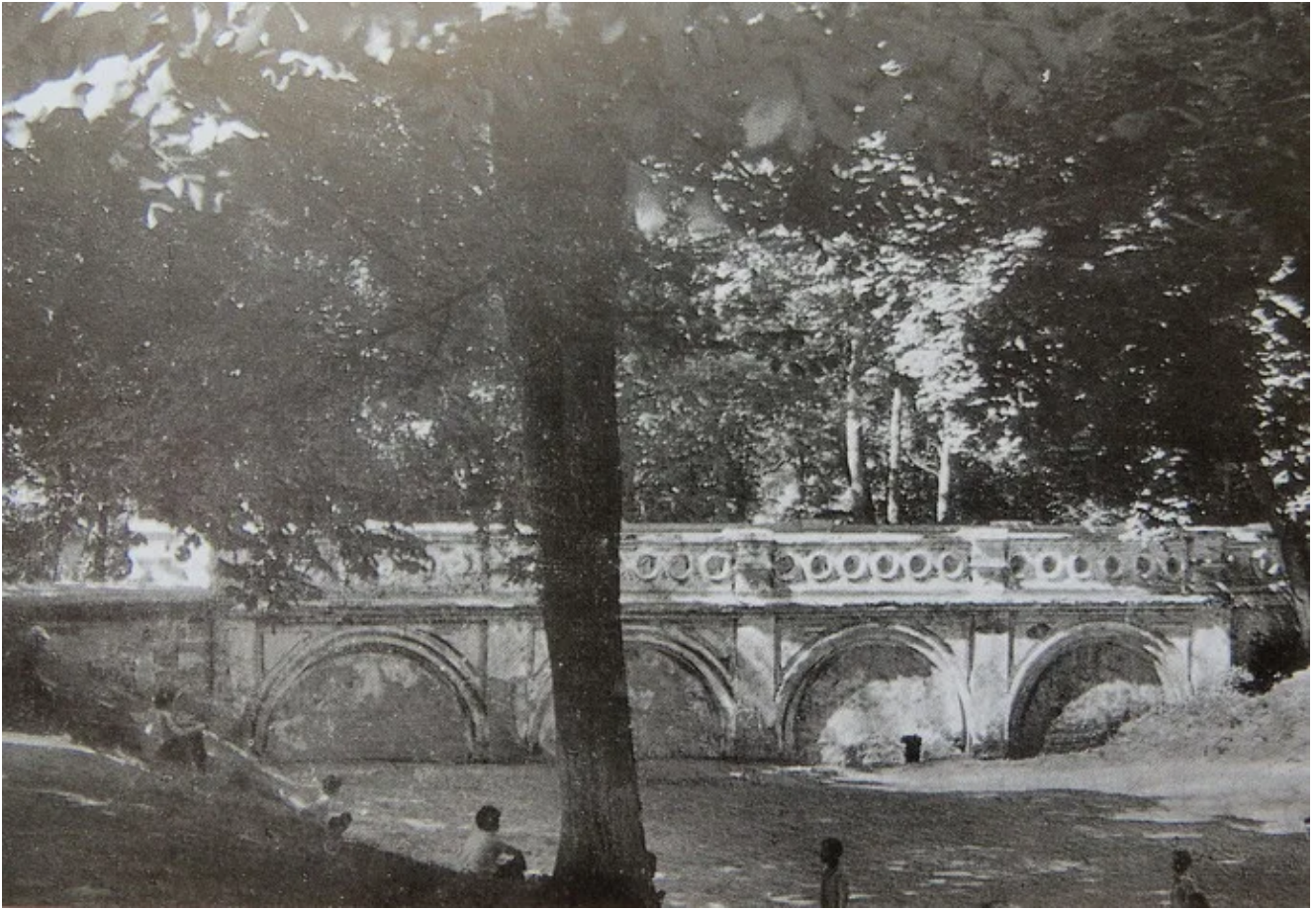
Старое фото моста в Демьянках.