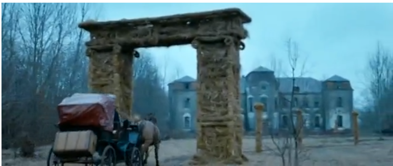
Кадр из фильма Масаkra

Была еще выпущена короткометражка Дом , тоже с материалами из усадьбы в желудке.