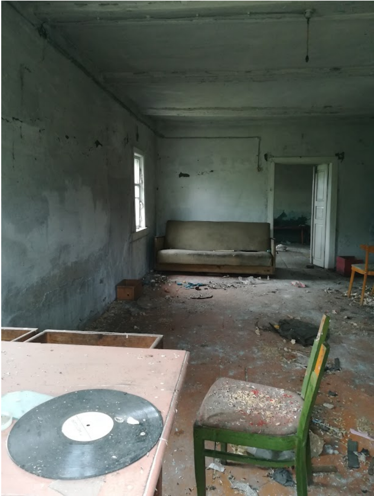
Интерьер одного из домов в Тульговичах 2019 год.

Видео с посещения деревни ЧЗ0 Тульговичи