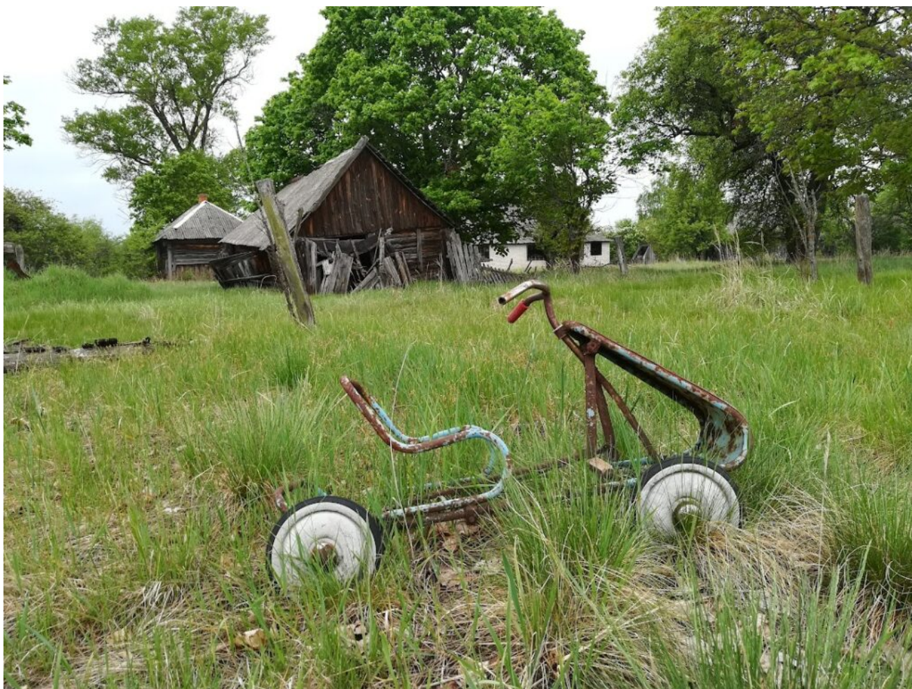
Двор в селе Тульговичи.

По сути обычная деревня, коих в зоне отчуждения Беларуси немало стала популярна благодаря жителю, который после принудительного выселения из родного села вернулся в эти края и наотрез отказался уходить из своей Родины. Называют таких жителей зоны – самоселы.