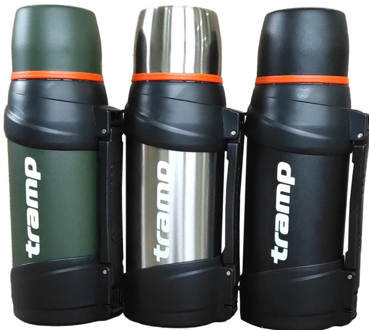
Аналоги Tramp Travel Line разных расцветок

Кстати аналогичная версия есть у того же известного китайского бренда снаряжения Tramp серии Travel Line . Наверное, делают термосы на одном китайском заводе, а конце штампуют разные бирки. Сходства видны не вооруженным взглядом. Чуть забегаая вперед отметим, что отзывы плохие, что на Следопыт серии Сафари, то на тот же Tramp Travel Line в одинаковой степени. Эти термосы поступили в продажу примерно с 2022 года и показали себя с наихудшей стороны.