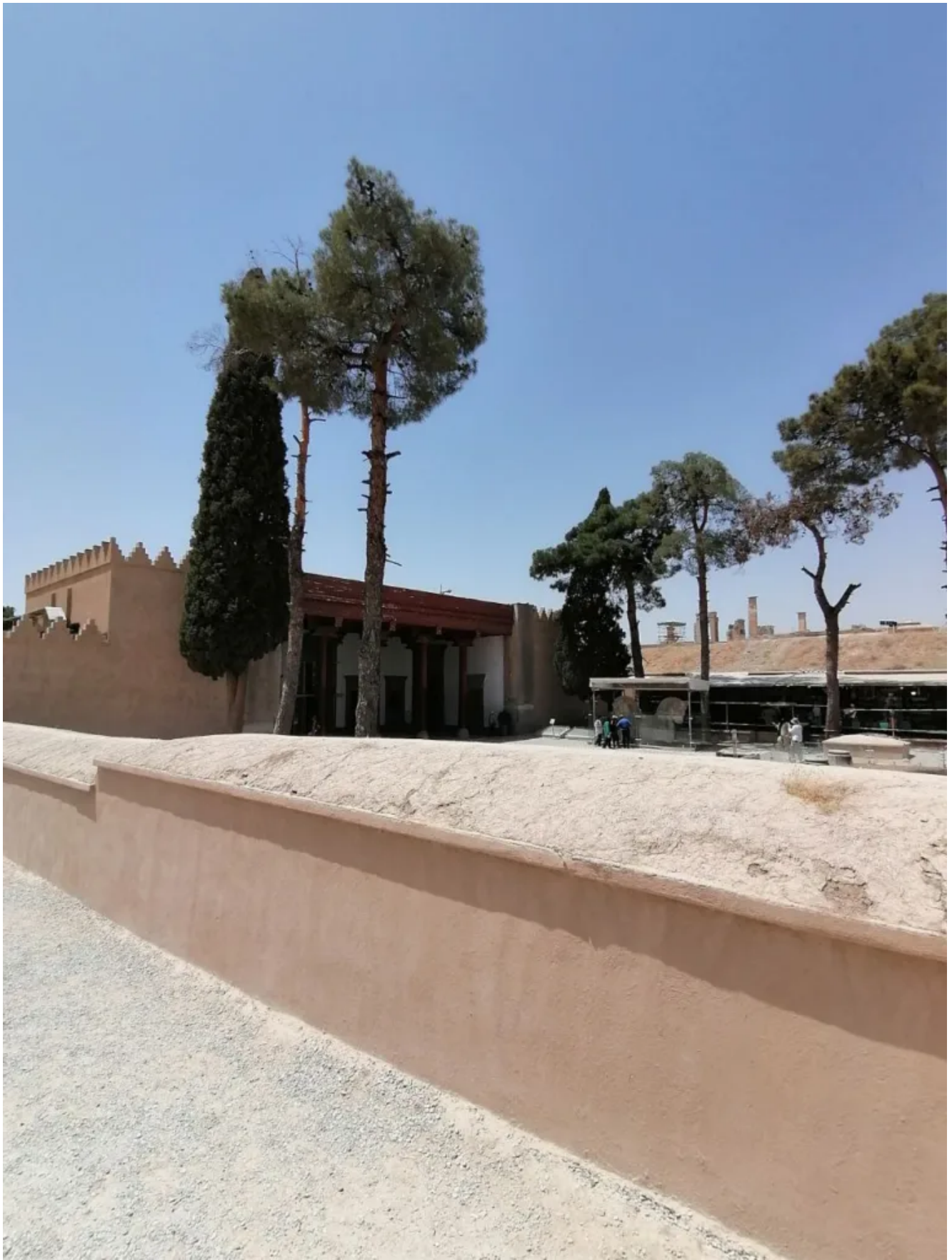
Вход в музей.