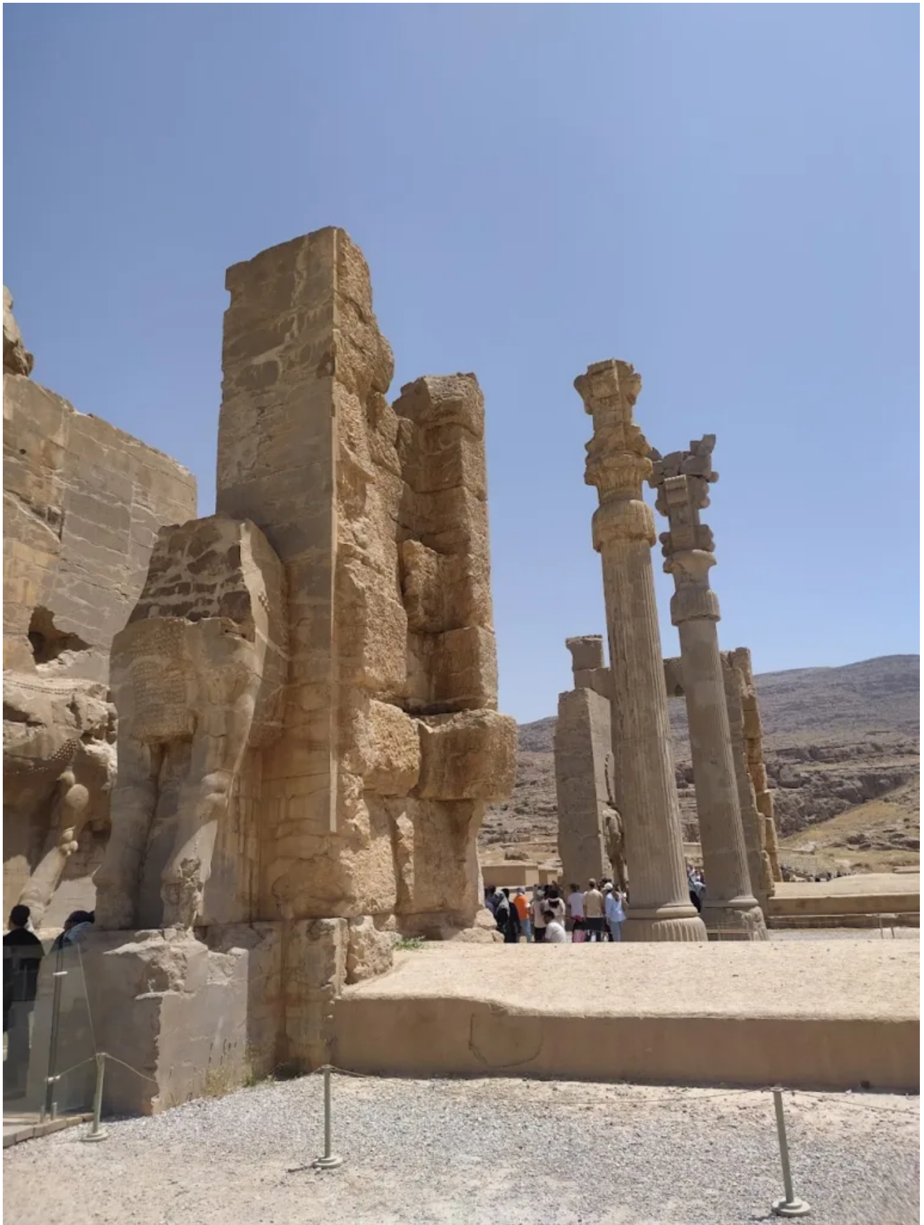
Также из оригинальных построек выделяется Гарем Ксеркса.