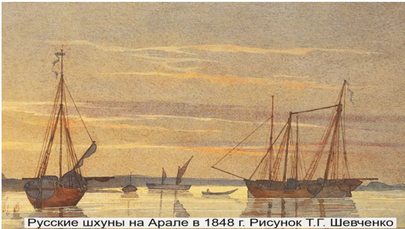
Русские шхуны на Арале в 1848 г. Рисунок Т.Г. Шевченко

Были созданы и военные корабли. Однако к концу 19 века флотилия была расформирована, так как дорого обходилась казне и свои основные задачи по захвату территорией были выполнены.