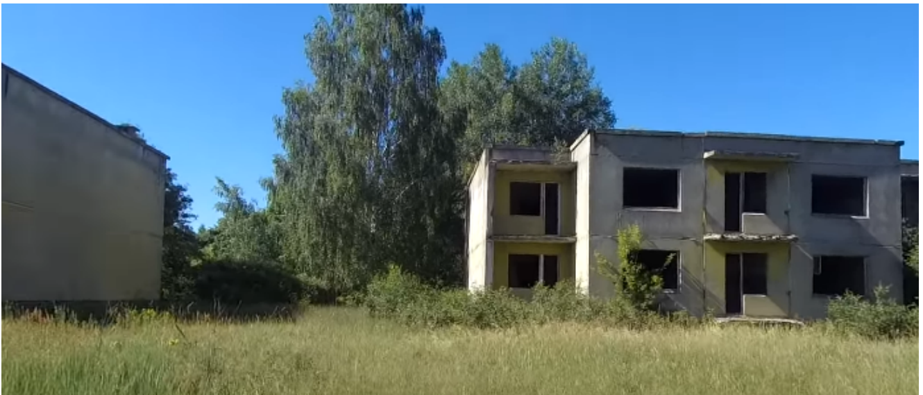
Недострои в селе Круговка.

Основные сооружения, которые сохранились – это школа, дом культуры, больница. Но все эти объекты прибывают в критическом аварийном состоянии.