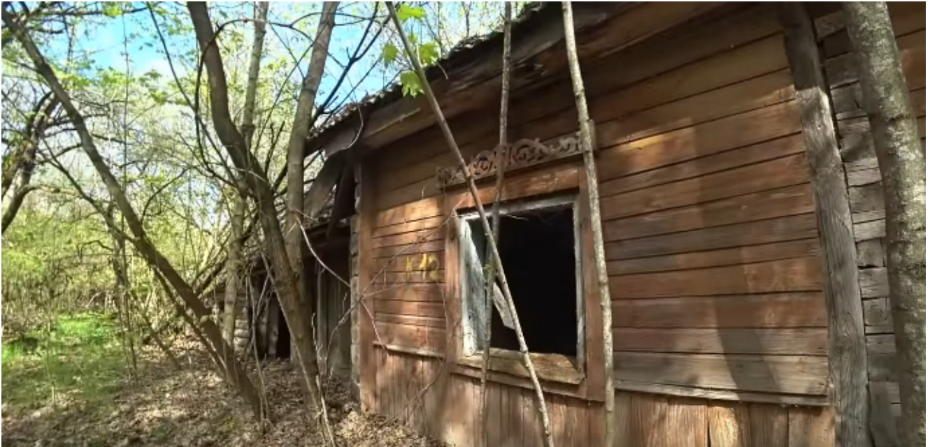
Покинутый дом в селе Березки