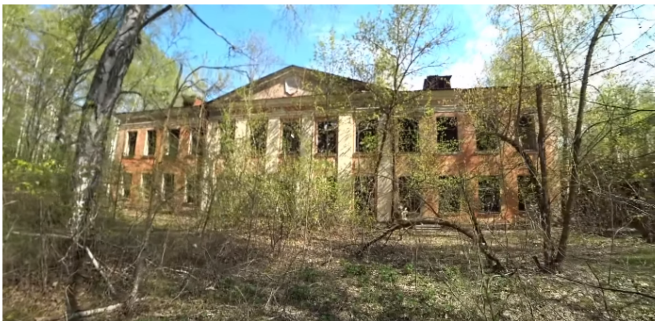
Заброшенная Школа в деревни Круговка

пункты выселяли не сразу. Массовое отселение началось в 1989 и 1990 году. Это поражает, ведь первоначальная степень загрязнения в этих местах не уступала районам прилегающим к ЧАЭС в нынешней зоне отчуждения . Многие люди поначалу не думали об опасности. Мол до Чернобыля 145 км, какая может быть опасность. По факту, оказалось, что вред радиация принесла серьезный на долгие годы.