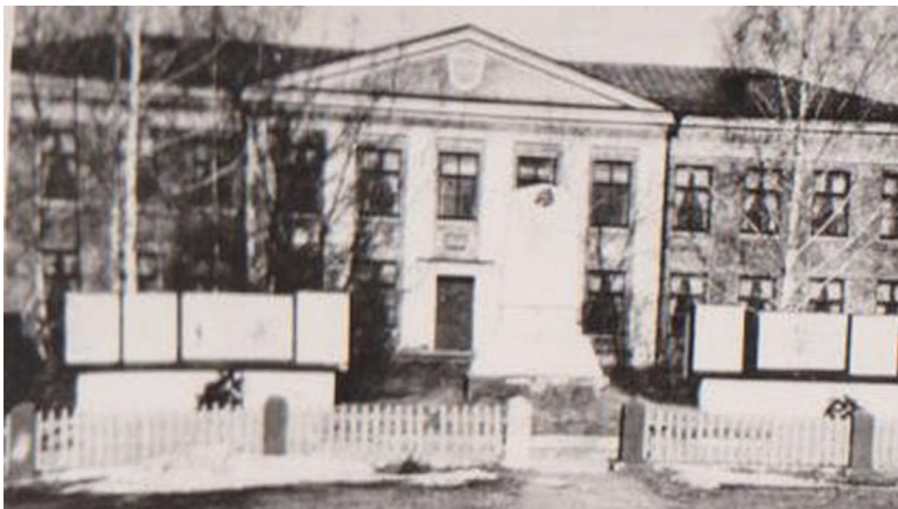
Школа в Круговке в 1980-е

Радиация в Беларуси после взрыва на Чернобыле разнеслась во