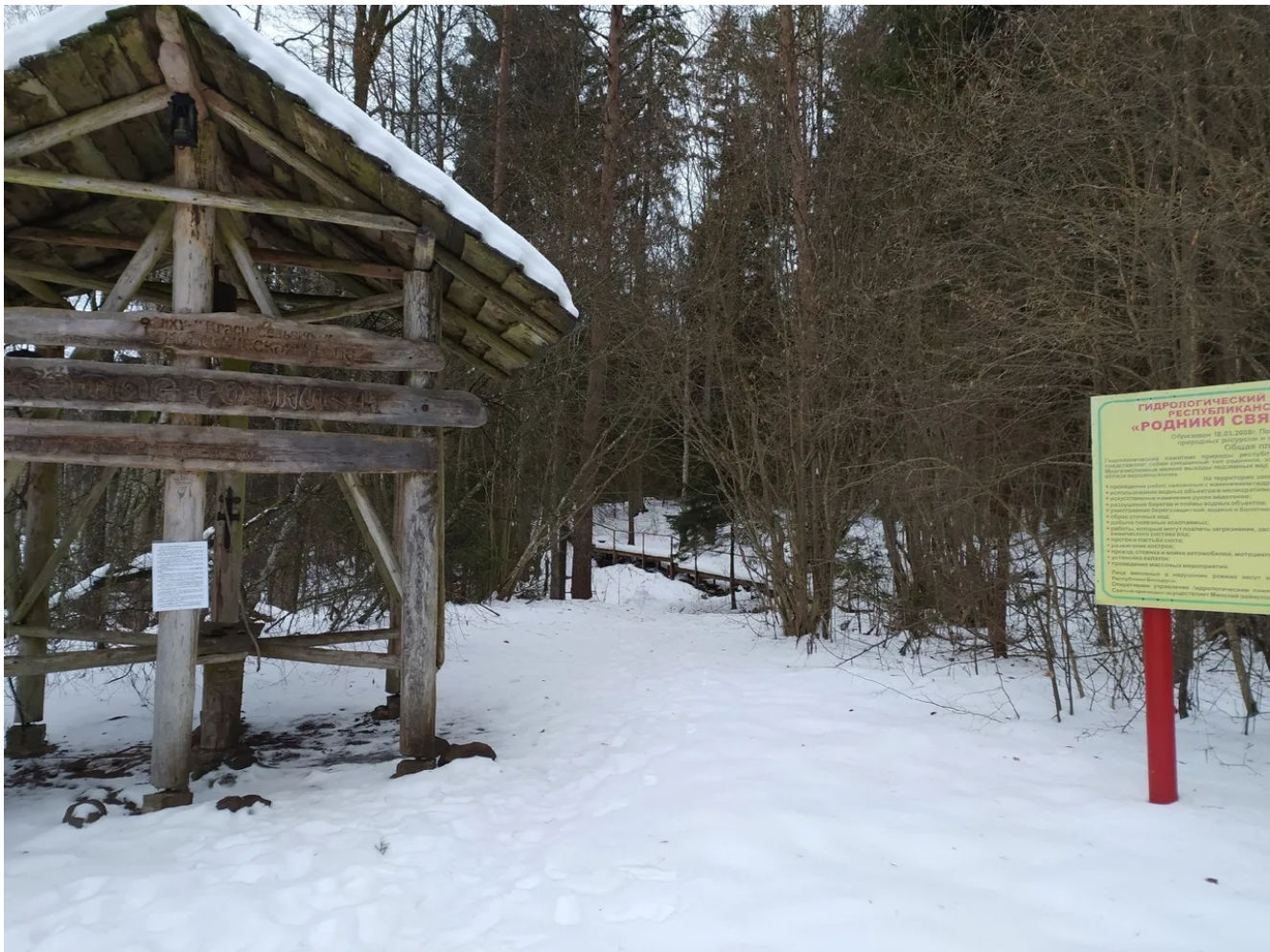
Колокольня на Святых Источниках