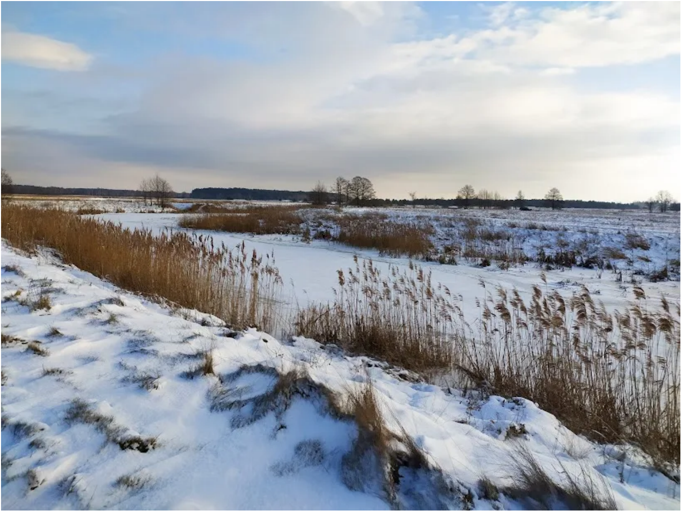
Река Уша у деревни Скоричи.