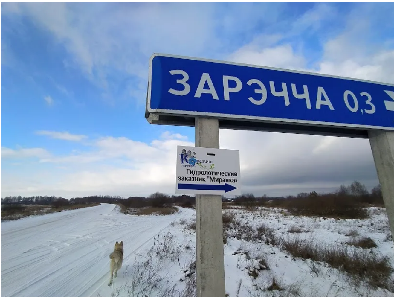
Обратный путь от деревни Заречье