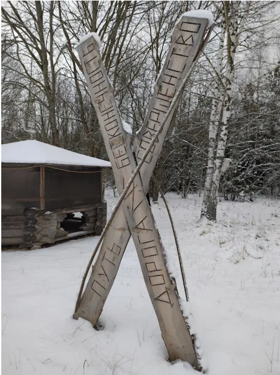
Возле агроусадьбы Студенка