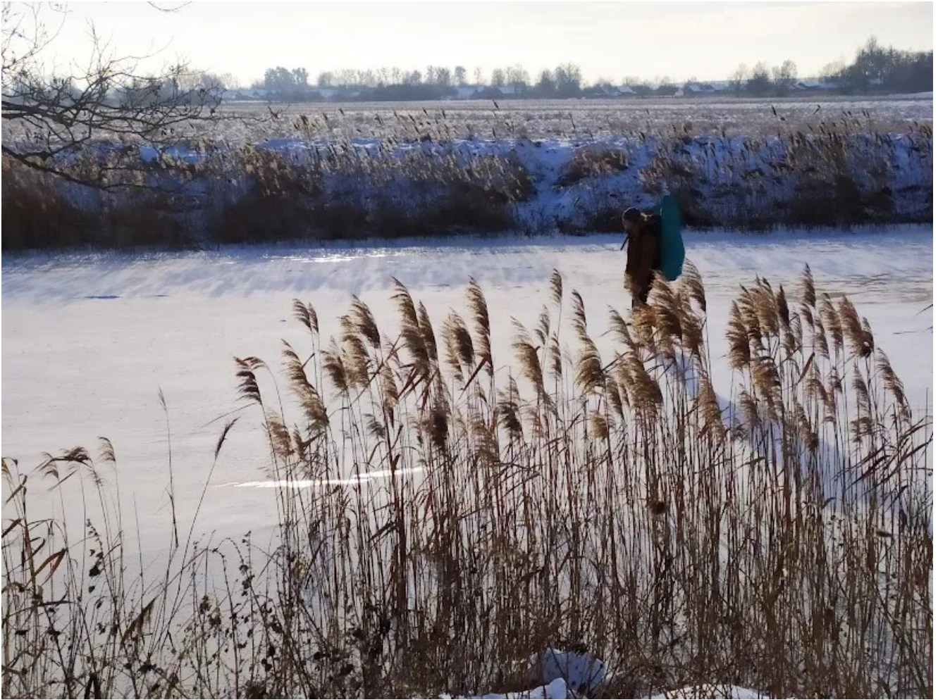
Второй день. Замёрзшая Уша.