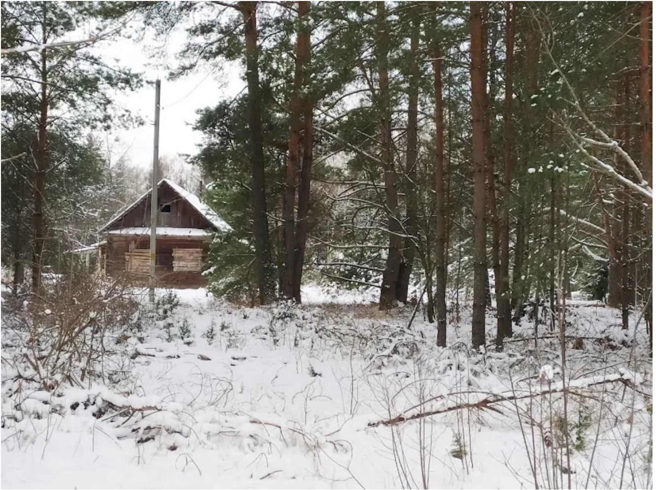
Дом в селе Луза по маршруту