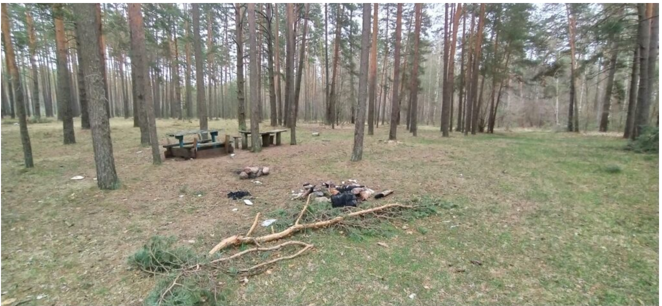
Третий кемпинг в лесу