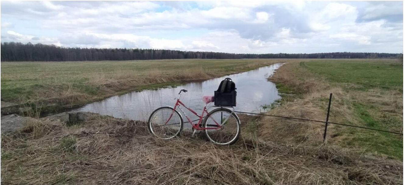
Канализированный участок Волмы