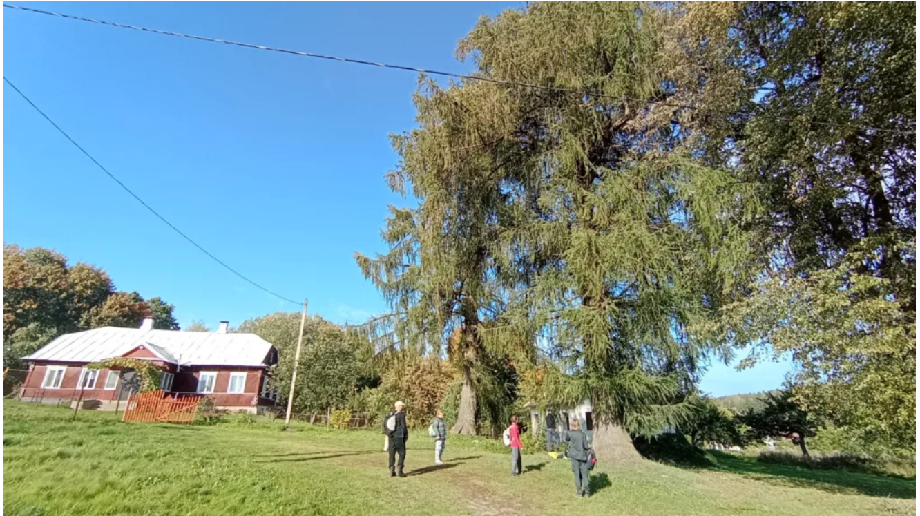
Остатки усадьбы Булгагов в Душково