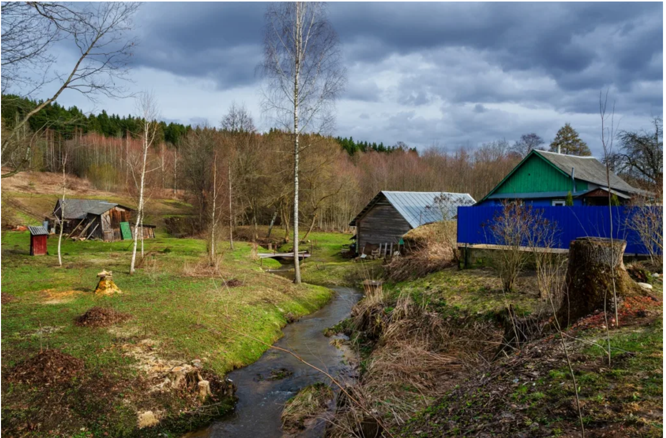
Душково, река Выгоничанка.