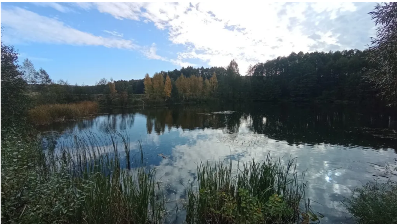
Пруд у села Выгоничи.