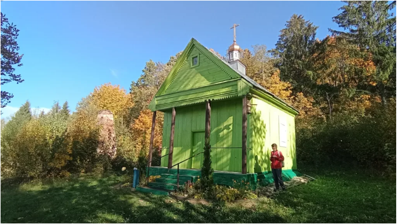
Часовня в Душково