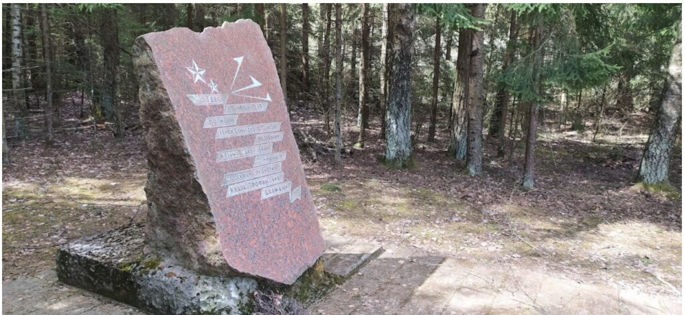
Памятник советский войнам в годы ВОВ