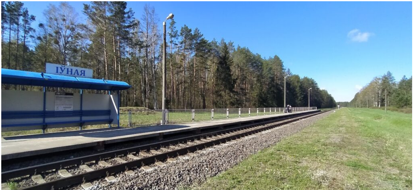
Начало маршрута. Жд станция Ивняя.