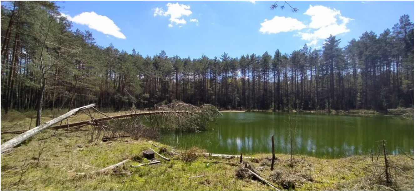
Озеро бездонное в Слонимском заказнике