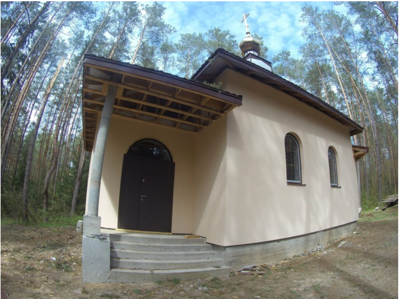
Часовня в Слонимском заказнике