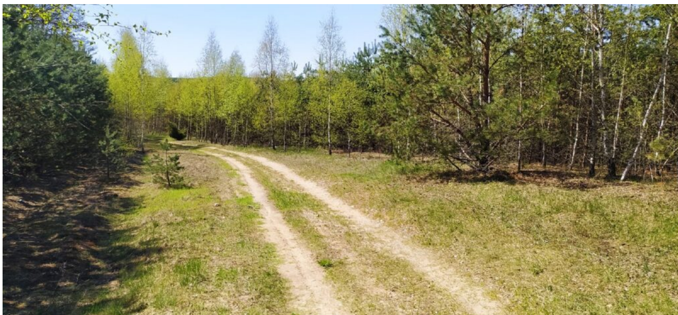
Тропы заказника Слонимский