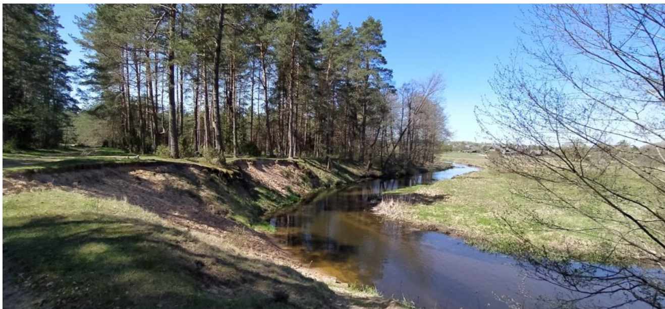
Живописная стоянка на реке Исса у деревни Хорошевичи