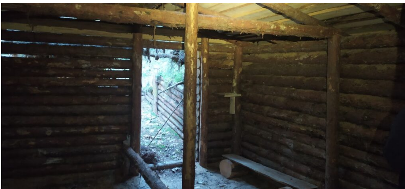
Партизанские землянки в заказнике