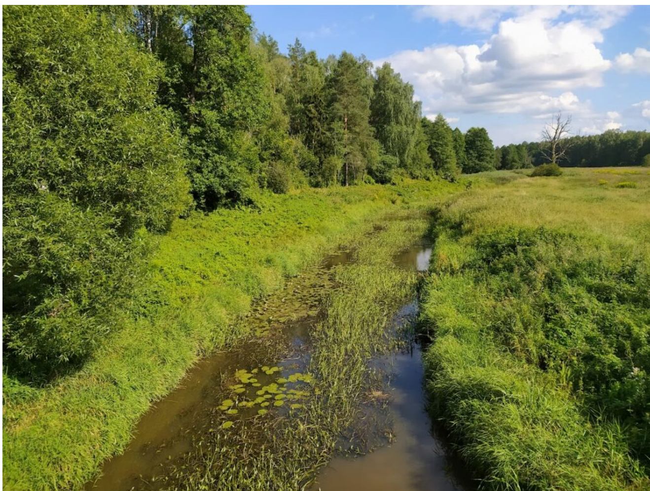
Фото с трека к озеру Гремячее

Мост при переходе реки Тальки, что на 5-м фото в сезон паводков может быть размыт.