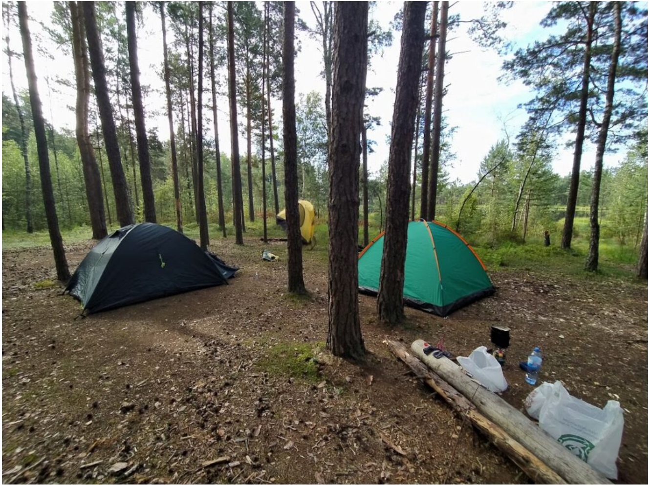
Стоянка на озере Гремячее