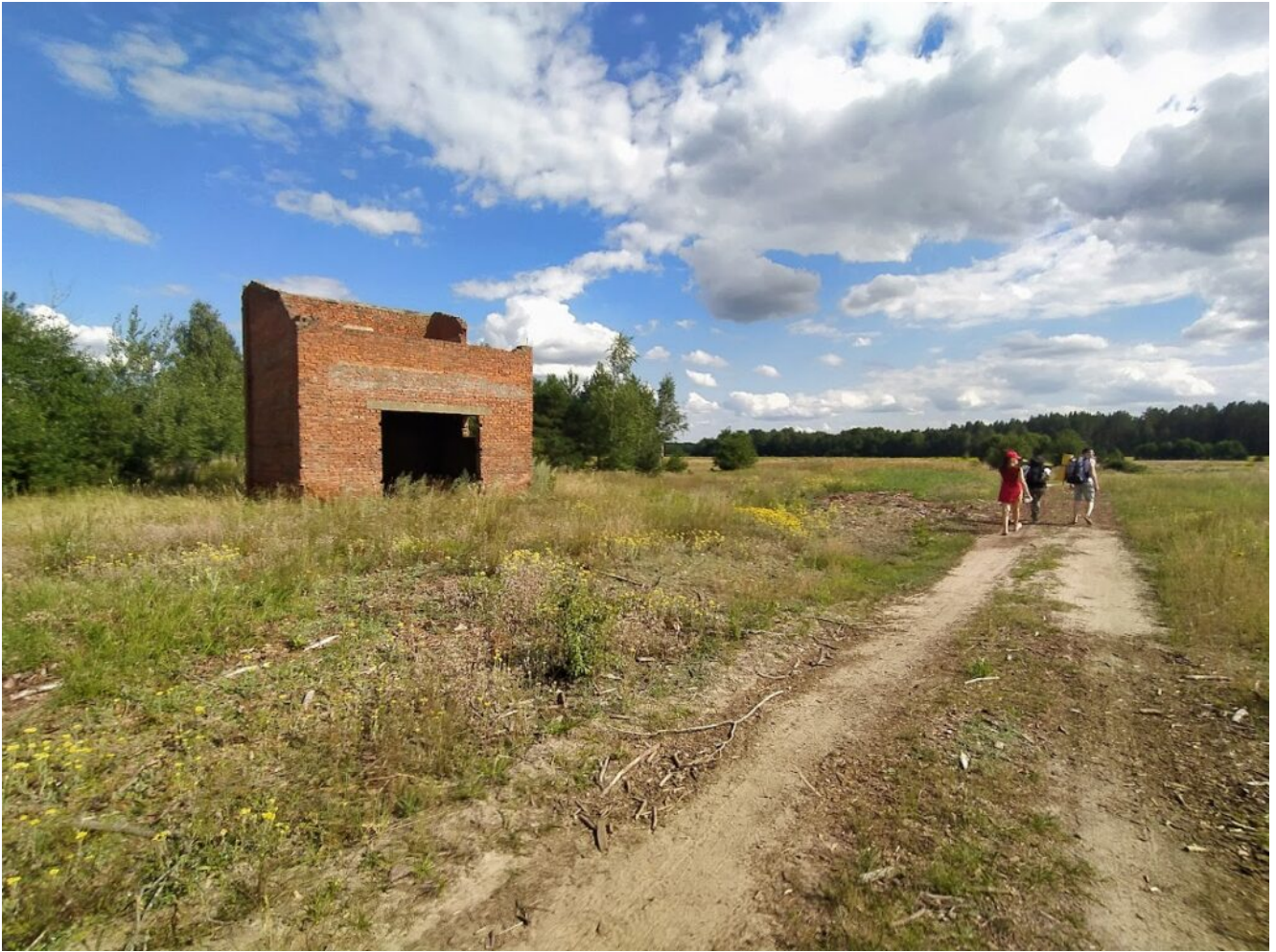
Остатки построек у деревни Матеевичи