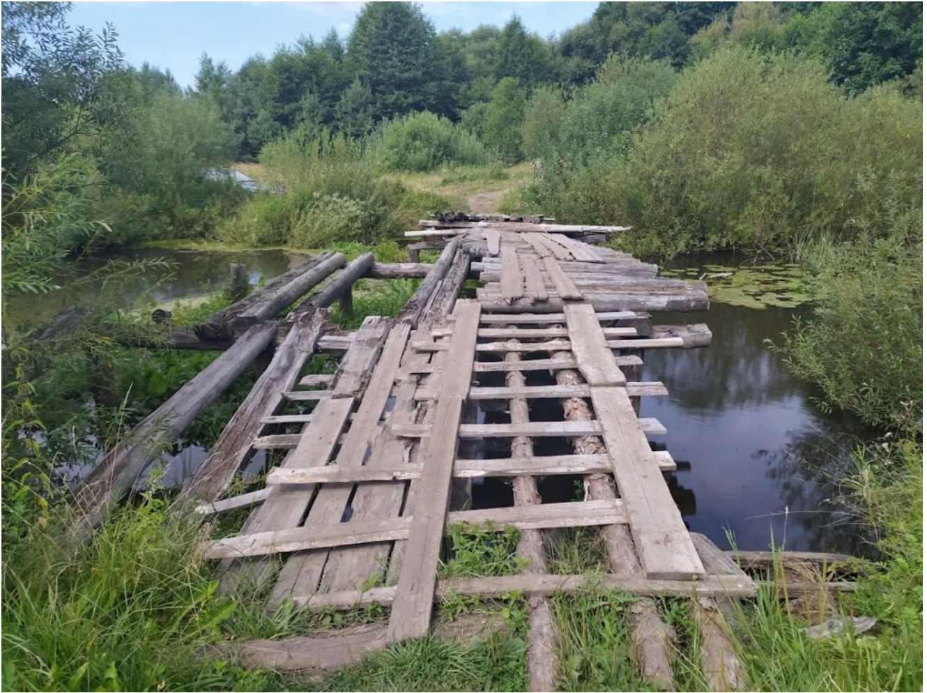
Мост от села к Гремячему