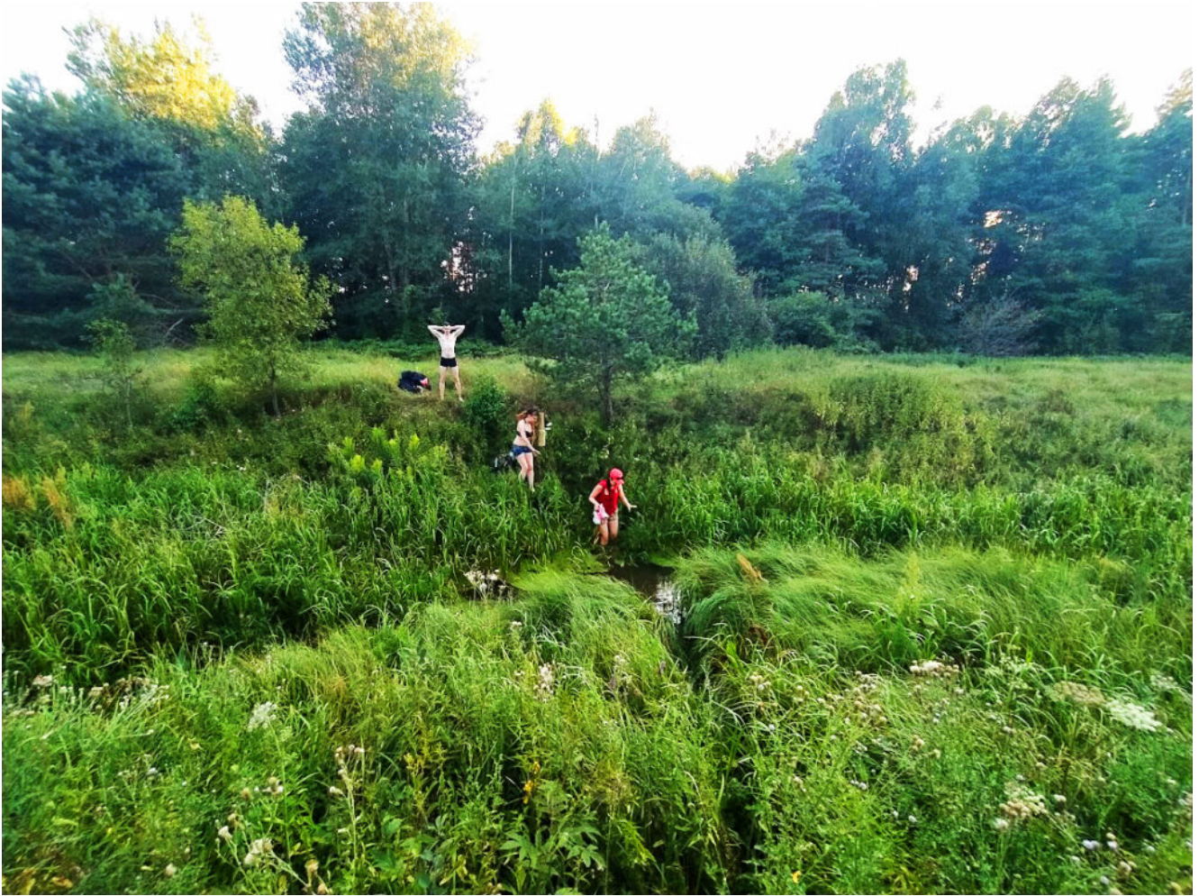
Брод через канал