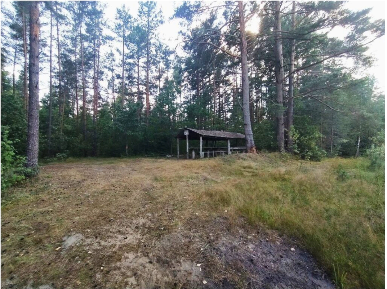
Кемпинг на реке Талька