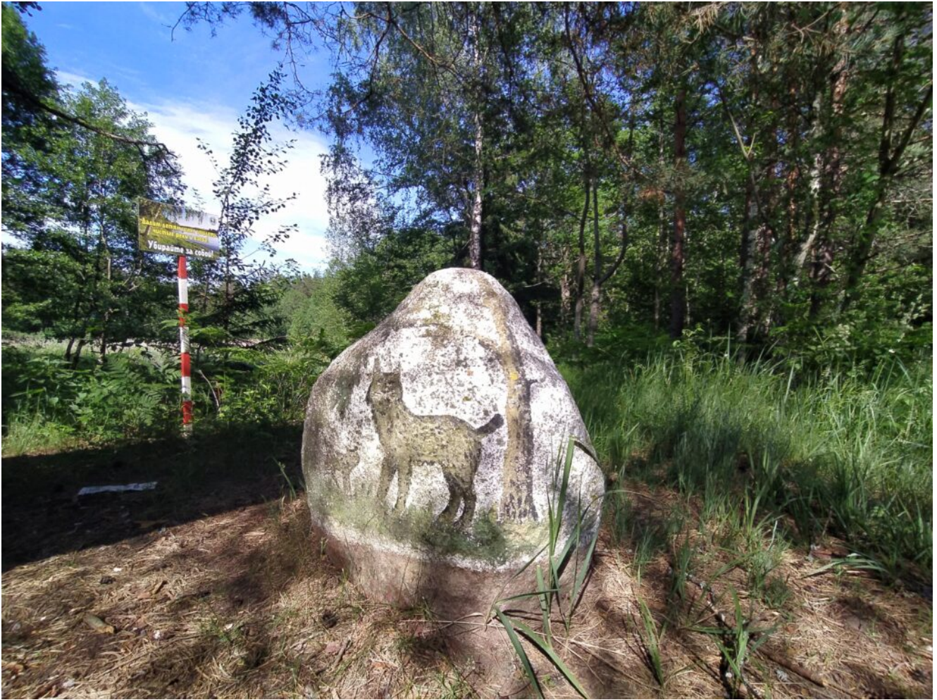
Живопись на камнях по пути на Еленку