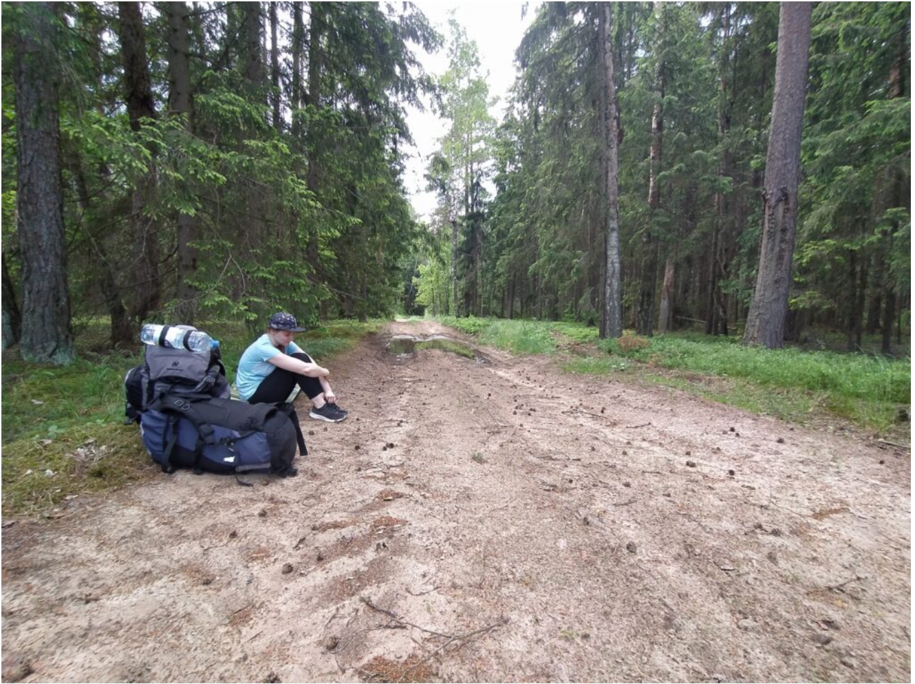
Лесные дороги к реке Еленка