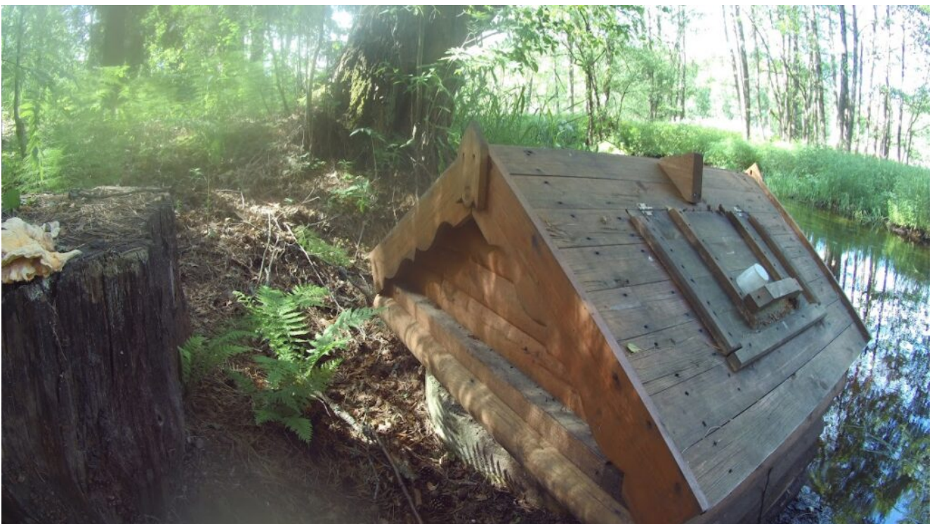
Родник на реке Еленка