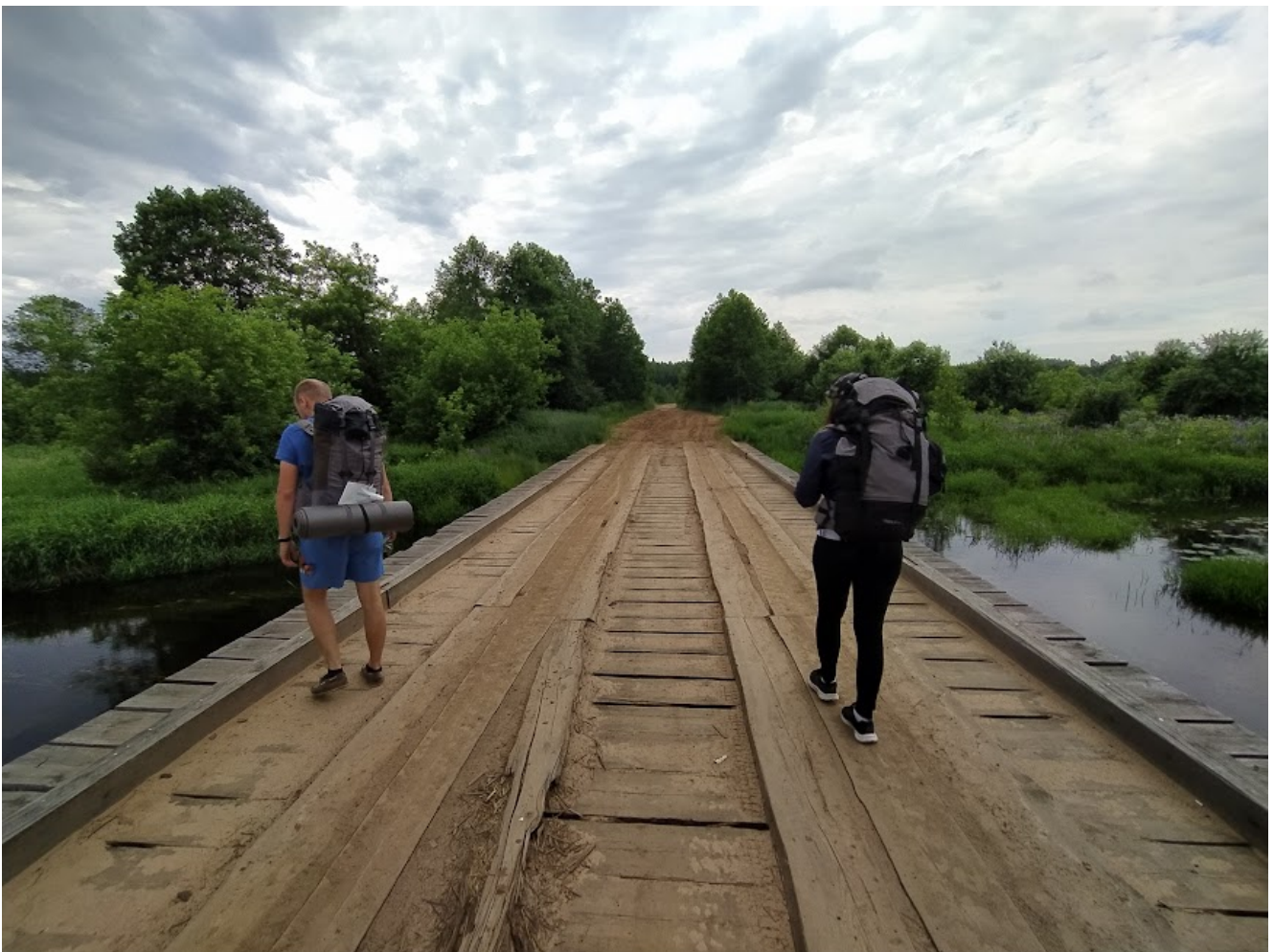
Легендарный мост через реку Бобр к урочищу Ширновичи