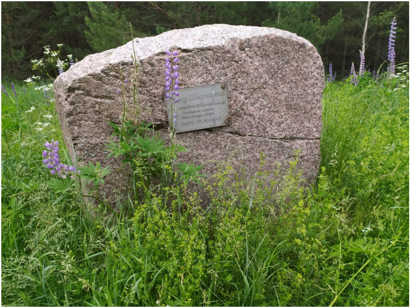
Памятный камень исчезнувшей деревни Ширновичи