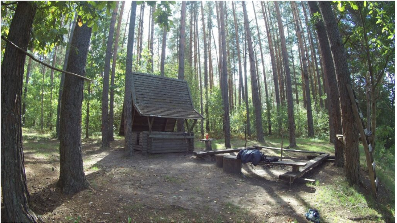
Стоянка на реке Бобр – Сонька