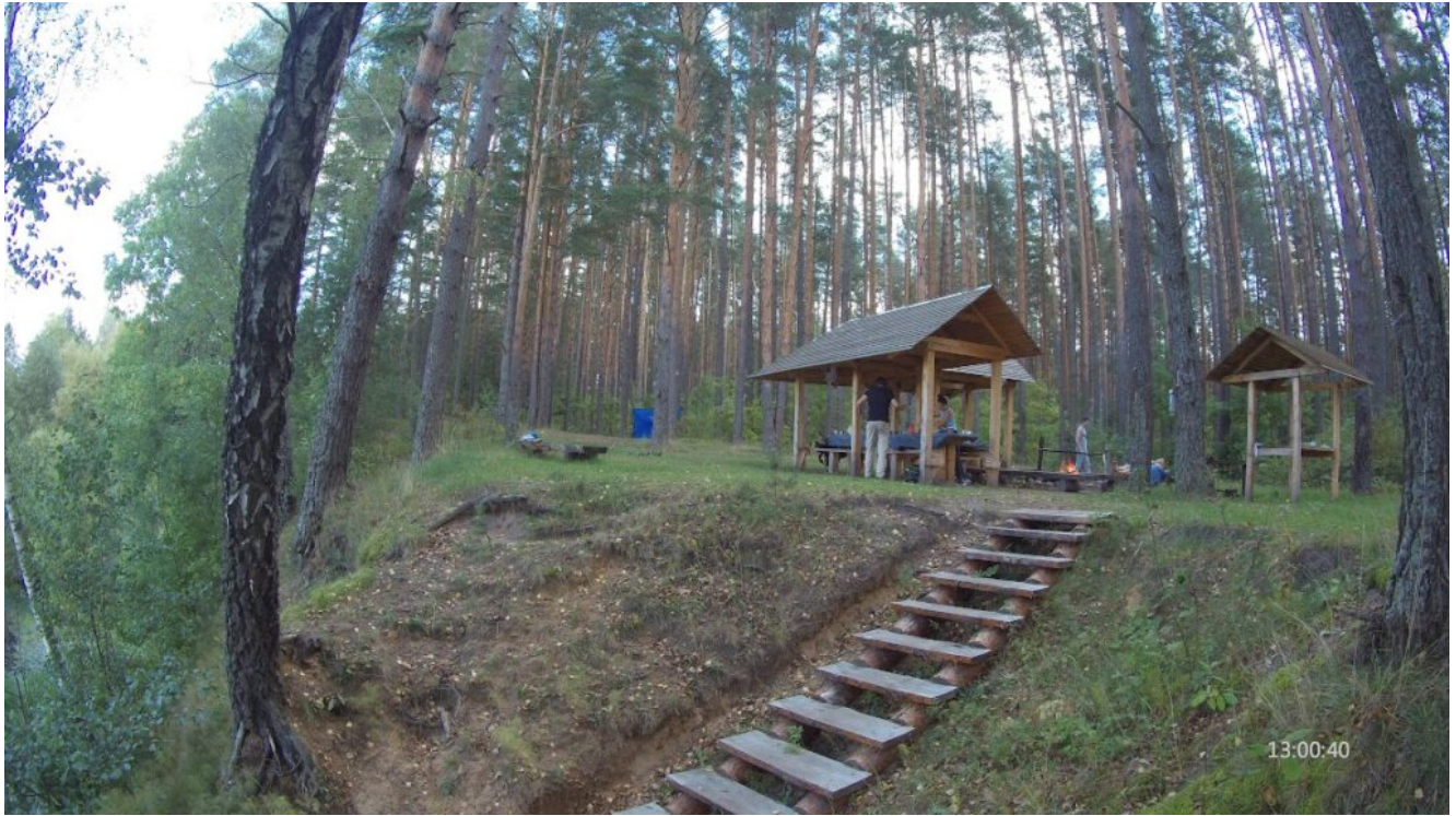
Стоянка на реке Бобр – Боброва Хатка