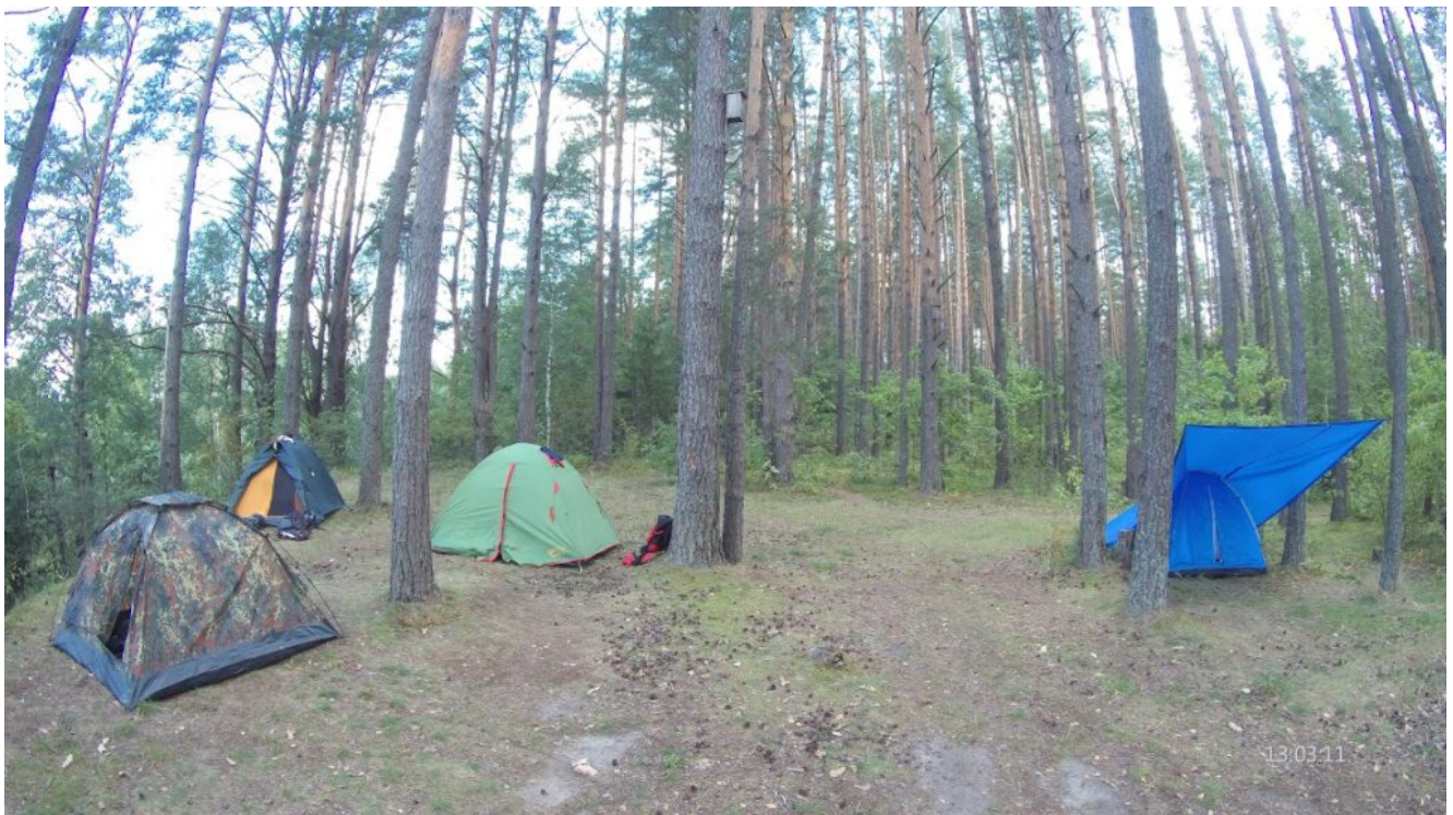
Стоянка на реке Бобр – Боброва Хатка