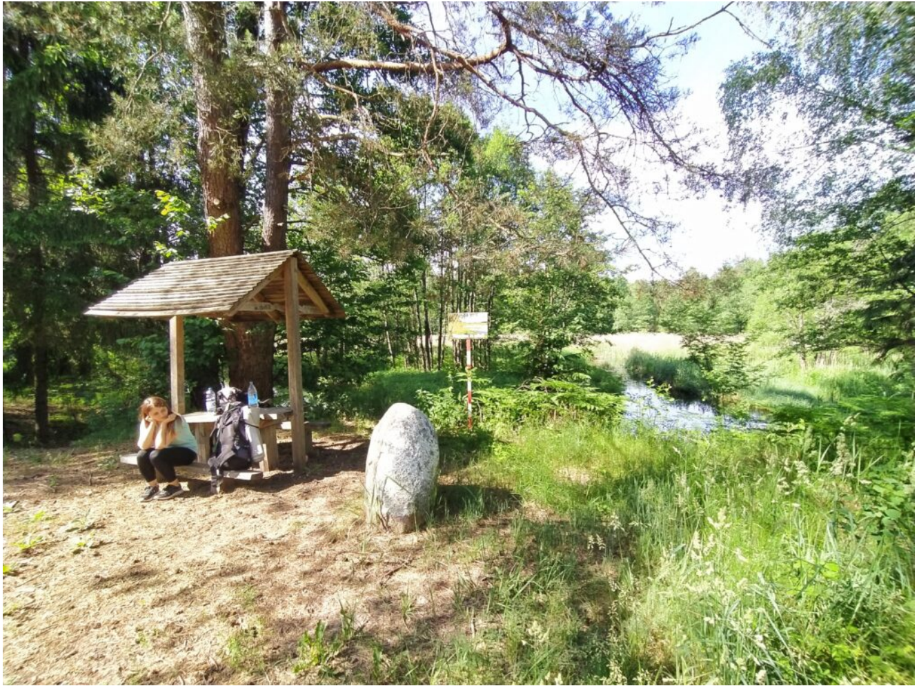
Стоянка, место для отдыха на реке Еленка