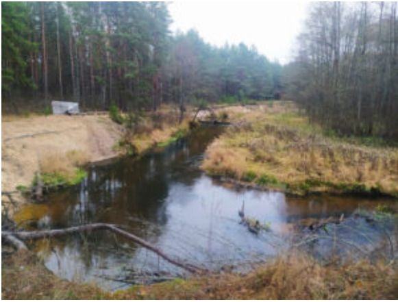
Стоянка на Усе