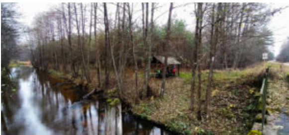
Место для привала при переходе реки Уса