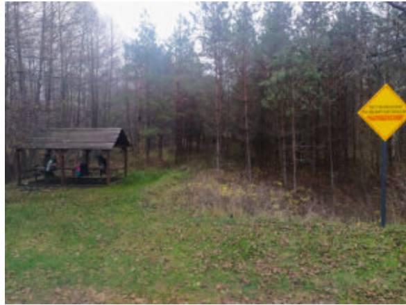
Беседка в Налибокской пуще и знак