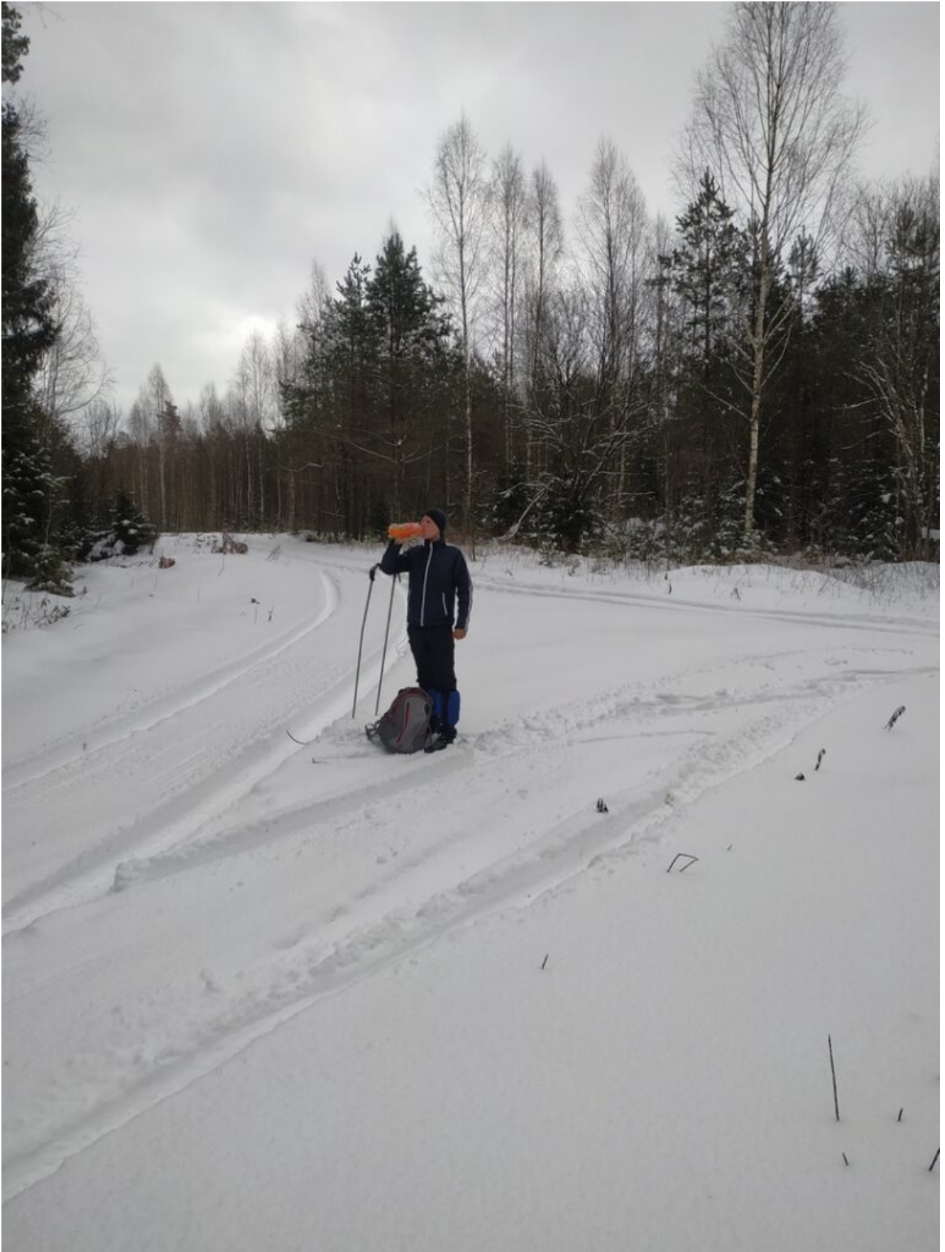
Развилка дорог к Дикому