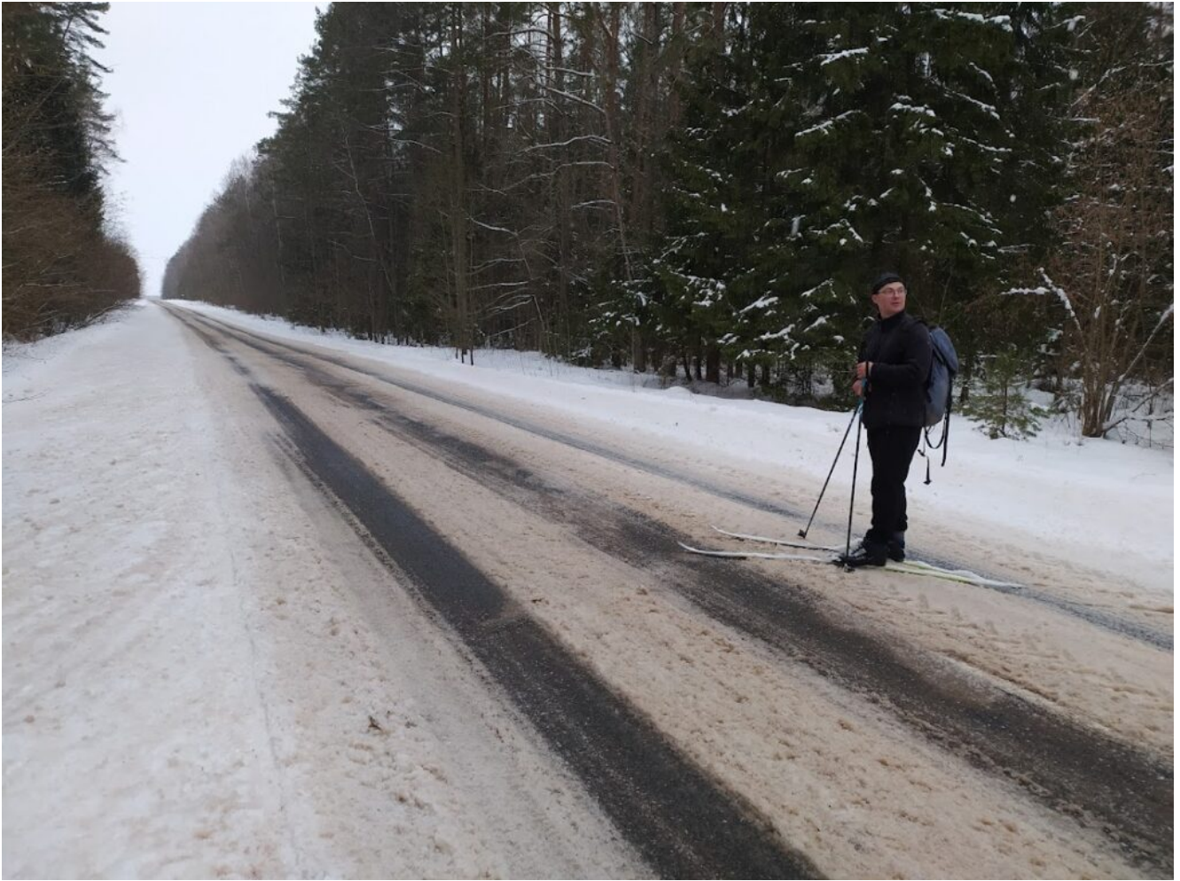
Выходим к трассе к д. Большие Укроповичи. Смотрим остановку.