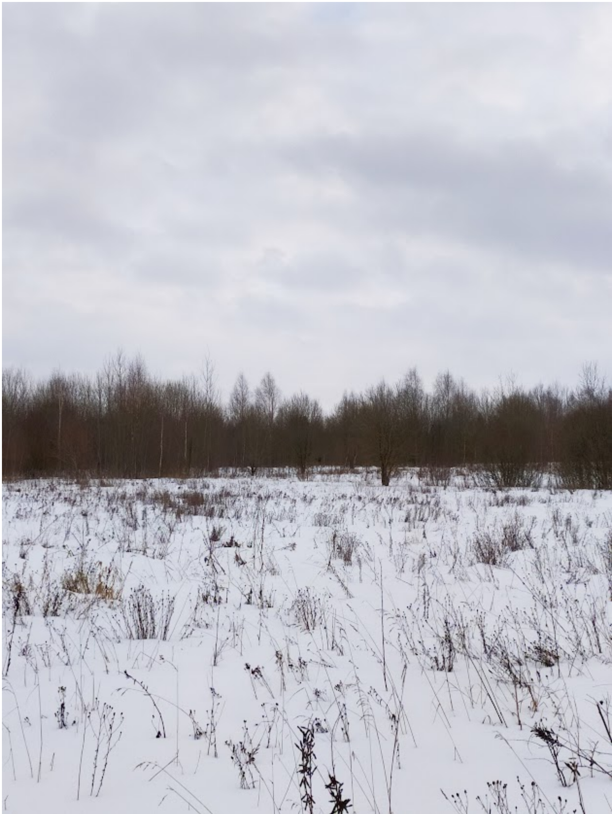
Животные где-то вдалеке снимка