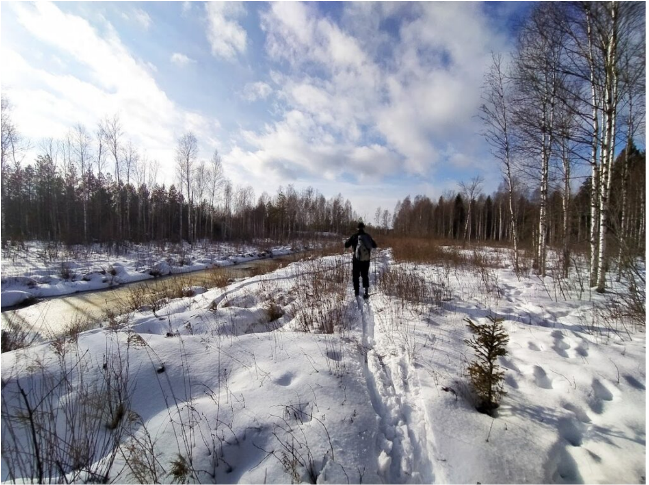
Каналы возле озера Дикое.