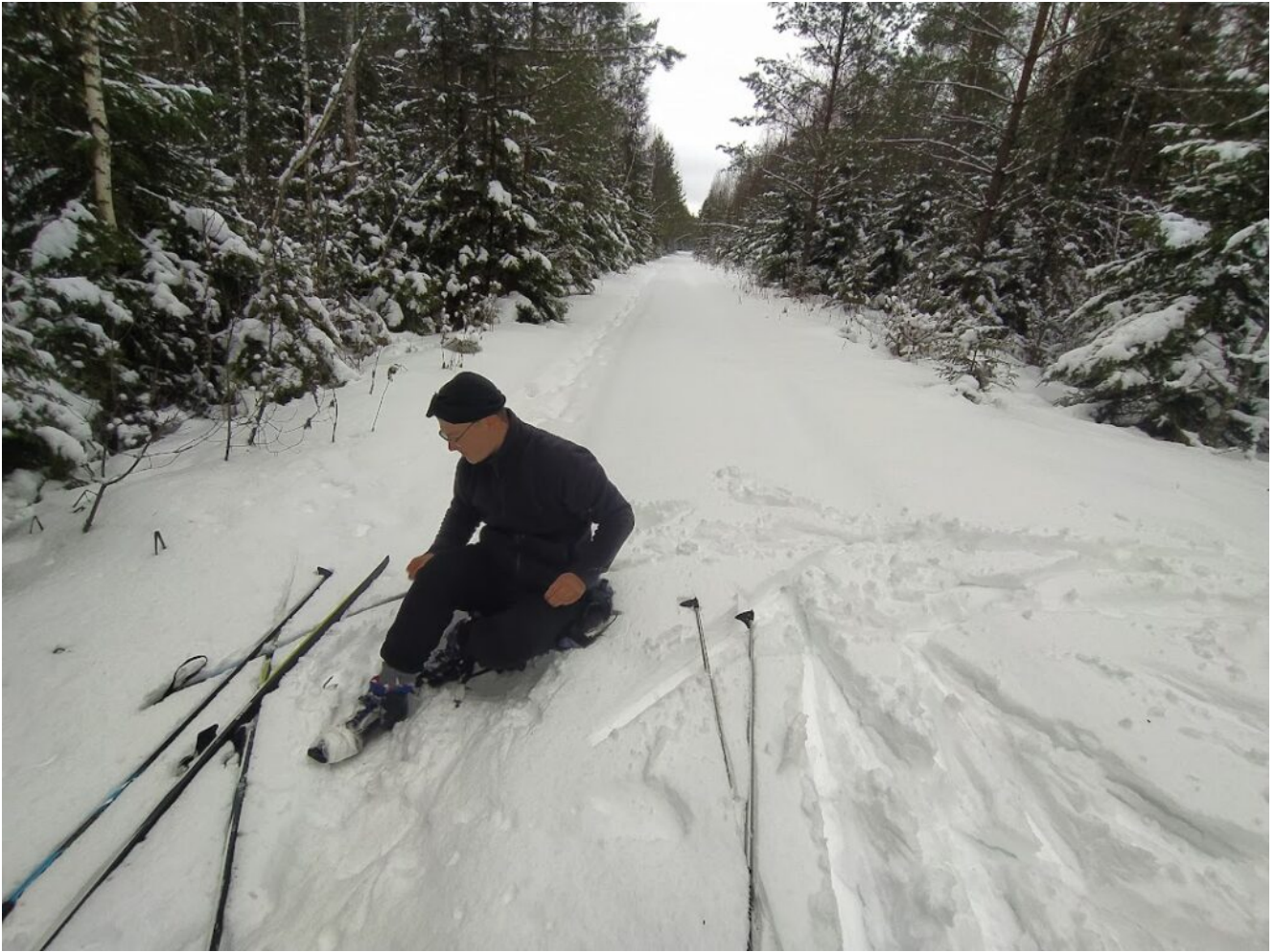
Дорога через лес к санаторию Рудня