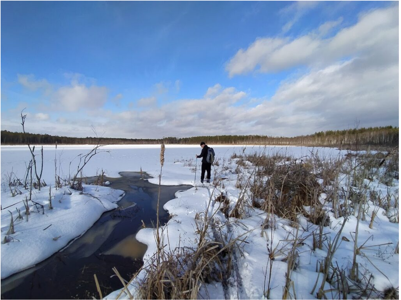
Выход к озеру Дикое