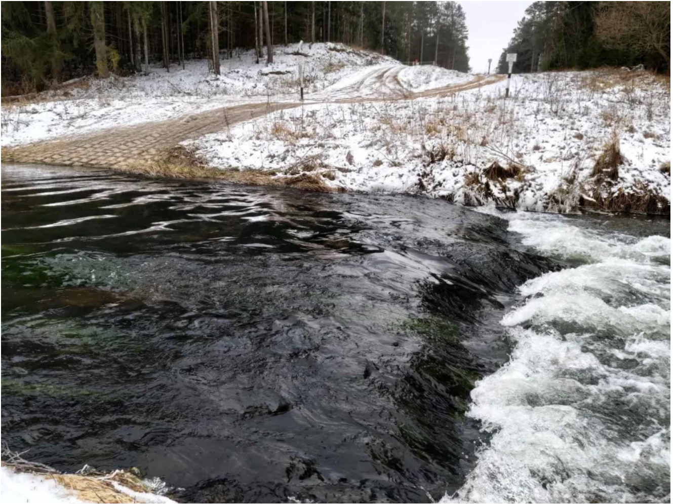
Кемпинг река Исlochь на 16.5 км.