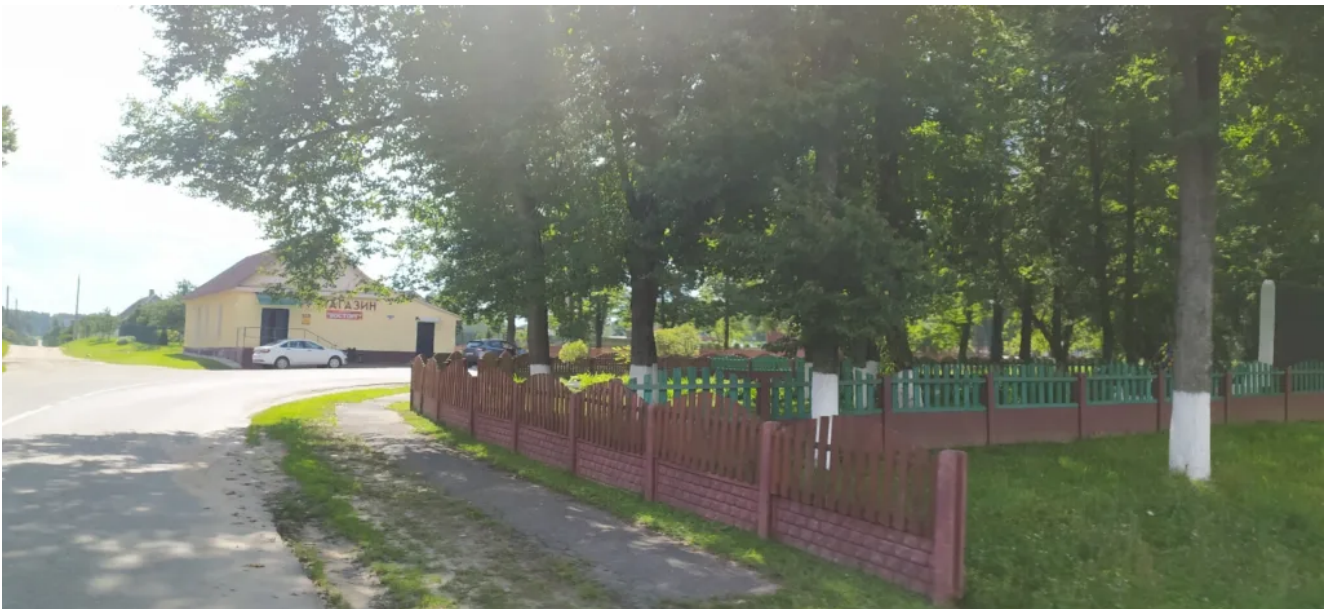
Далее легендарный костел в руинах.