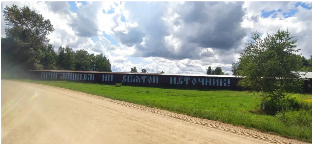
16 километр пешего маршрута. Душевная стоянка Боброва Хатка.