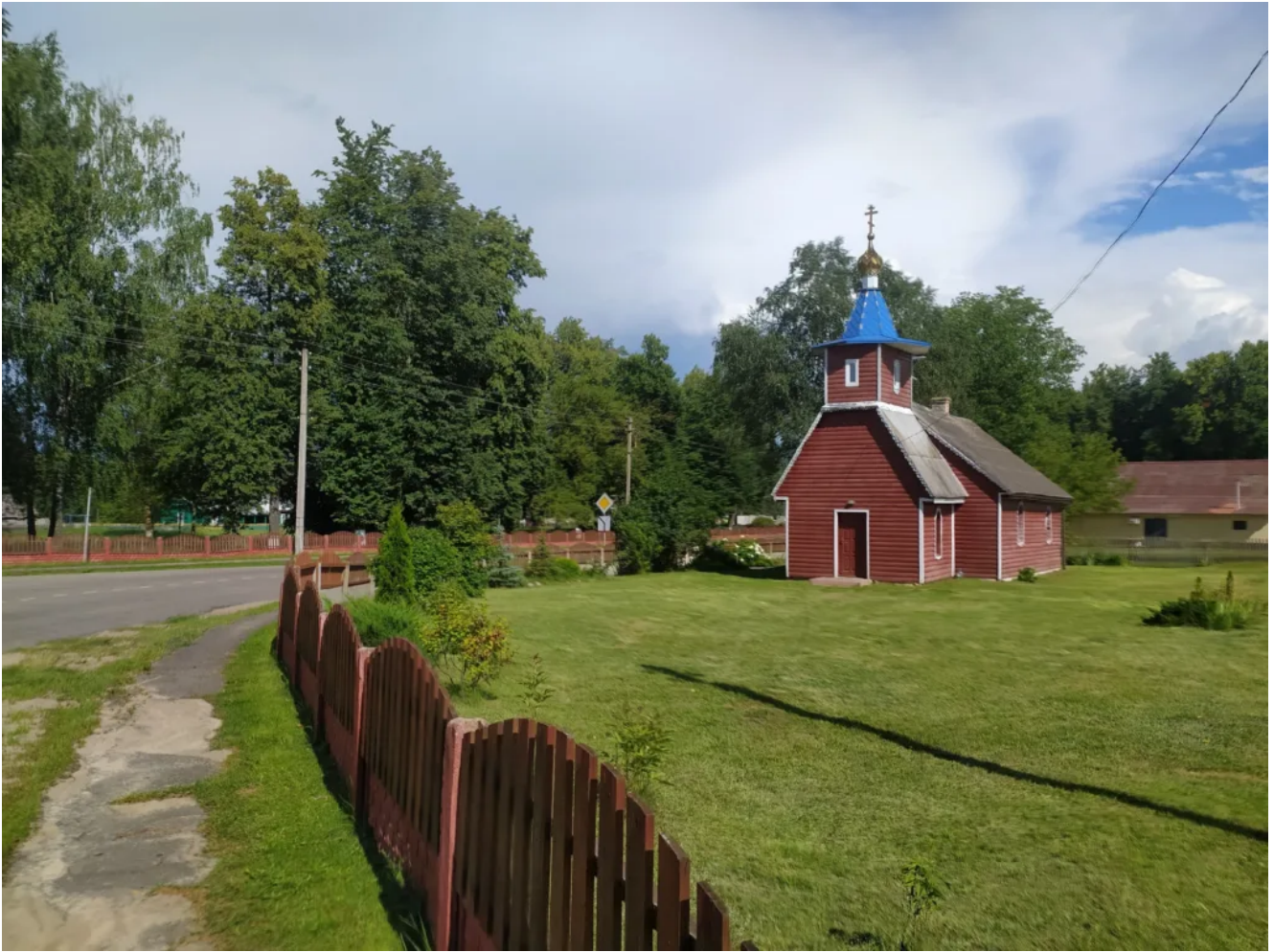
Рядом будет и магазин.