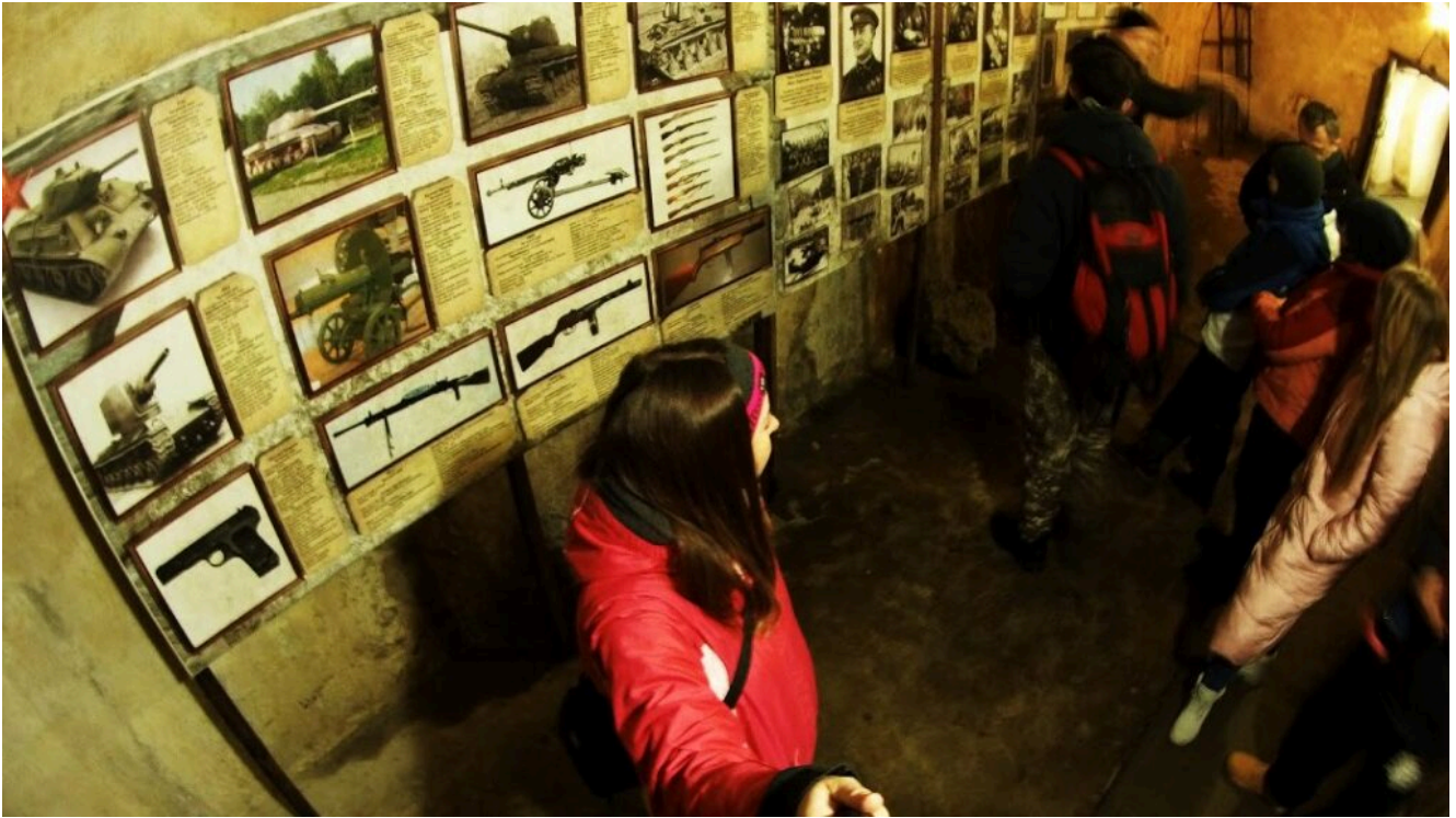
Экспозиция исторического плана в музее бункере Арпада.