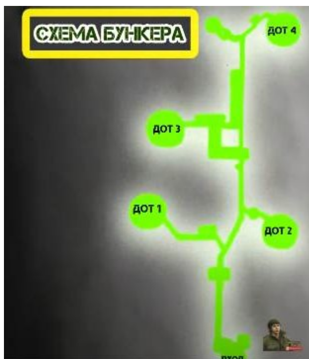
Схема бункера Арпада

СССР, тем самым предоставила возможность советским войскам в 1944 году нанести удар по венгерской линии с тыла. Две недели удерживали оборону позиций венгерская армия, но после с тыла советские войска взяли неприступную крепость.