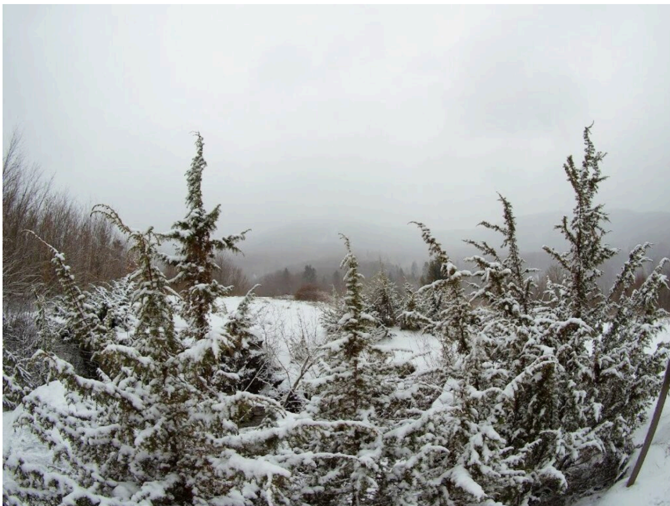
Лес поросший сверху бункера.

Главный Командный Бункер , расположился среди Закарпатских лесов между горами в селе Верхняя Гробовница . Относится бункер как раз к оборонительной линии Арпада, названной в честь героя венгерской истории, вождя угорских племен прародителей современных венгров.