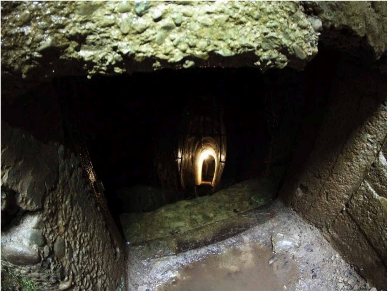
Проход в тоннель бункера Арпада.